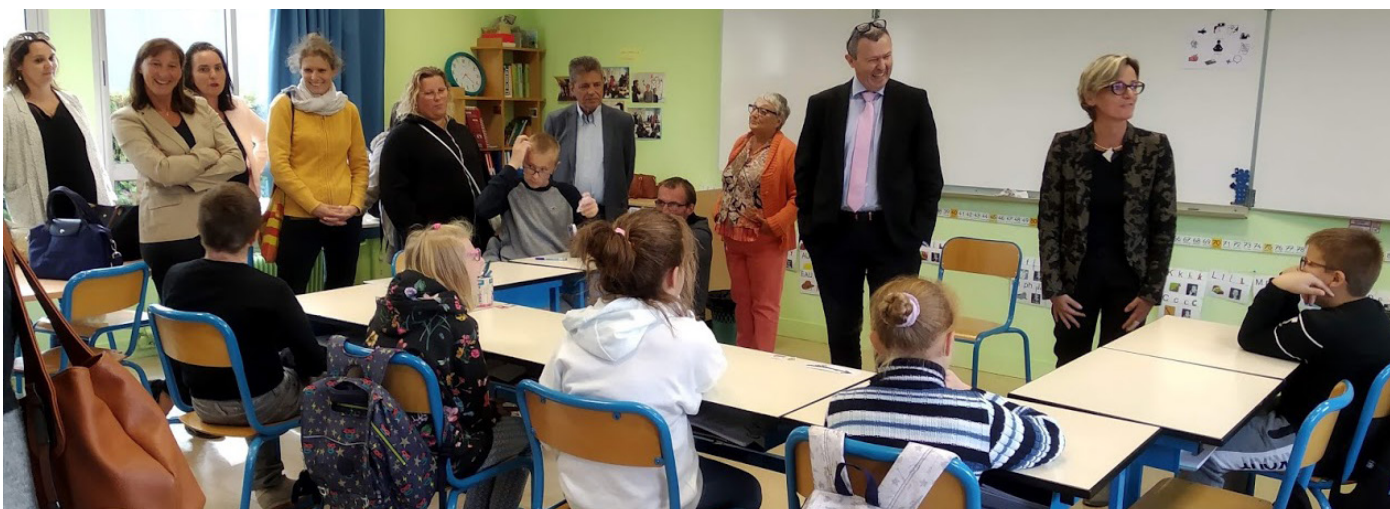
Inauguration UEE IME Le Chant du Loup à l'école du Village de Canteleu, 5 septembre 2019.